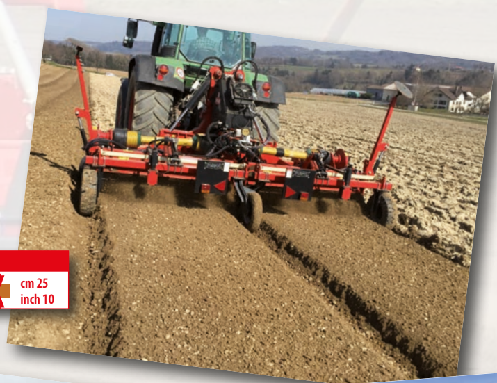
Serie DD45 HP 130÷250 kW 96÷184 cm 25 inch 10

Baulatura con cofano baulatore Bed with rear bed former hood