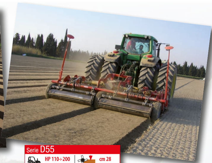
Serie D55 HP 110÷200 kW 81÷148 cm 28 inch 11