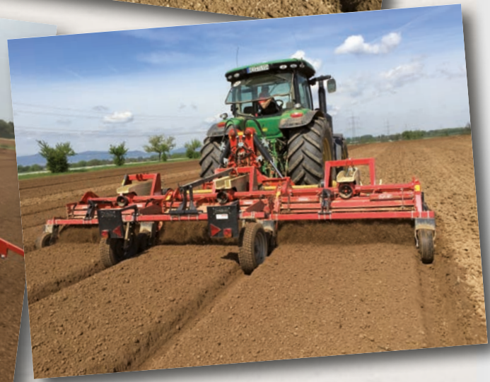
Serie TD45 HP 220÷300 kW 162÷221 cm 25 inch 10