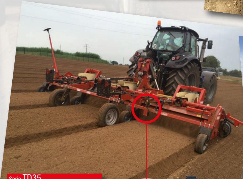
Serie TD35 HP 180÷250 kW 133÷184 cm 20 inch 8