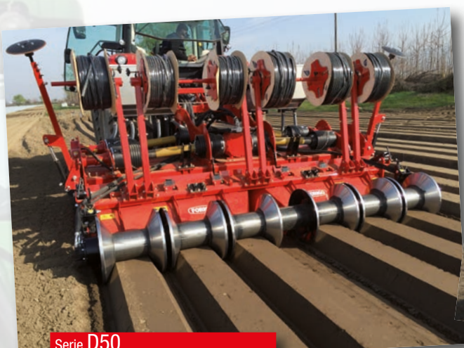
Serie D50 HP 90÷140 kW 67÷103 cm 25 inch 10